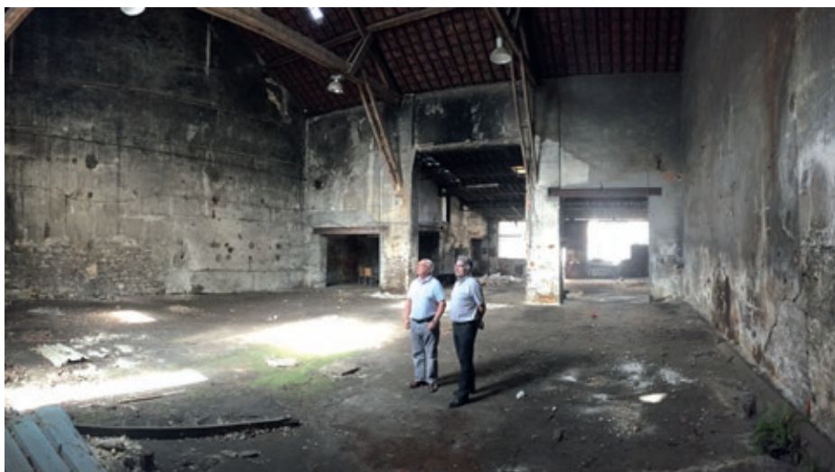
▲ Visite du futur Centre technique Municipal par le Maire Jean-Luc Herkat et Claude Bonnet, premier adjoint au maire. De généreux volumes qui seront prochainement réhabilités et permettront d'accueillir les ateliers et les garages municipaux.

Le budget 2018 lance ce projet de création d'un local qui permettra de stocker l'ensemble des outils, véhicules et fournitures des services techniques de la ville (plantations, matériels pour fêtes et cérémonies, sel de déneigement, décorations de Noël, etc.). Les agents communaux utilisent actuellement des locaux devenus trop petits dans les dépendances de la mairie et de la salle polyvalente. Le projet porte sur la réhabilitation des anciens bâtiments de l'entreprise Joder, rue de Gonesse en cœur de village, que la ville a rachetés récemment après l'abandon d'un projet de transformation en logements par un promoteur privé. Offrant une surface au sol d'environ 400 mètres carrés et d'un généreux volume